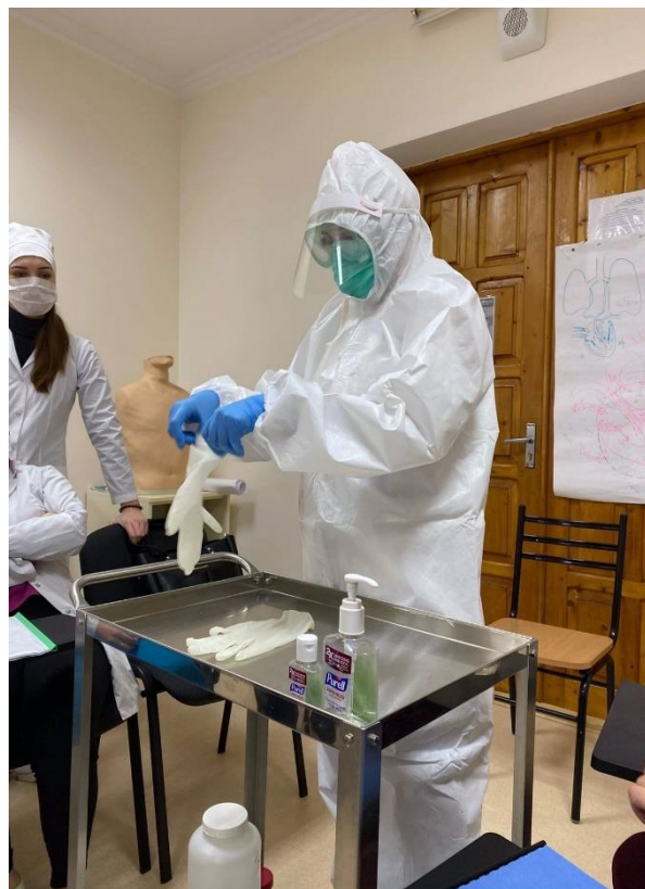
PRETESTAREA – aprilie

Orarul Consultațiilor în grupele absolvente, semestrul II Anul de învățământ 2020 - 2021 Secția de învățământ № 4 Calificarea „Asistent medical”